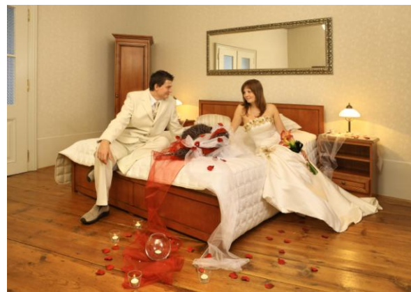
Svatební apartmá Gustav