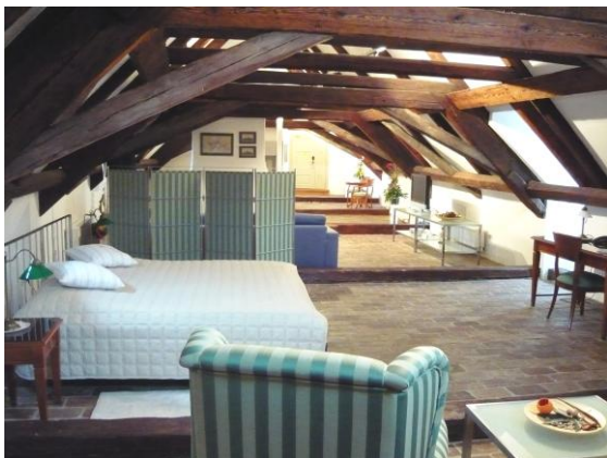
Prezidentské apartmá Alma

U svateb nad 30 hostů svatební pokoj pro novomanžele zdarma.