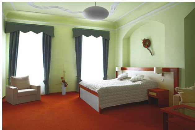
Junior Suite A103

V případě speciální požadavků na výzdobu pokojů pro svatební hosty nebo ubytování v Českém Krumlově nás neváhejte kontaktovat!