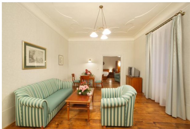
Předsálí svatebního apartmá Gustav